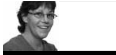
Cathaidh Màiri Nic a'Mhaoilein

Tha na pàipearan-naidheachd air bhoil thairis air na seachdainean seo, agus tha gu leòr a' dol a chumas cagnadh riutha. Am measg na tharraing m'aire fhèin, eadar gach nì cudromach a tha a' dol san t-saoghal, tha e do-chreidsinneach gu bheil Riaghaltas Bhreatainn ann an suidheachadh far a bheil dùthchannan eile a' dèanamh tàir air an dòigh san tug iad cead dha na seòladairean a chaidh a shaoradh à Iran, an sgeulachd innse dha na meadhanan.