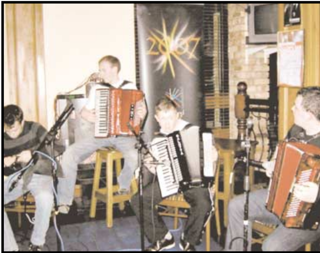
An còmhlan òg à Alba a bha rin cluinntinn aig an fhèis fad na còig là