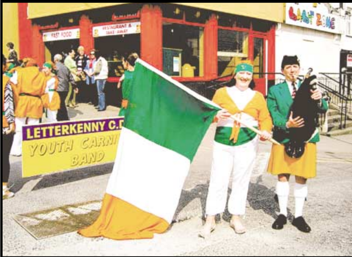
Chaidh Fèis a' Phan-Cheilich a chumail ann an Èirinn an t-seachdain a chaidh, far an robh mòran fealla-dha agus far an deach gu math dha na h-Albannaich a ghabh pàirt