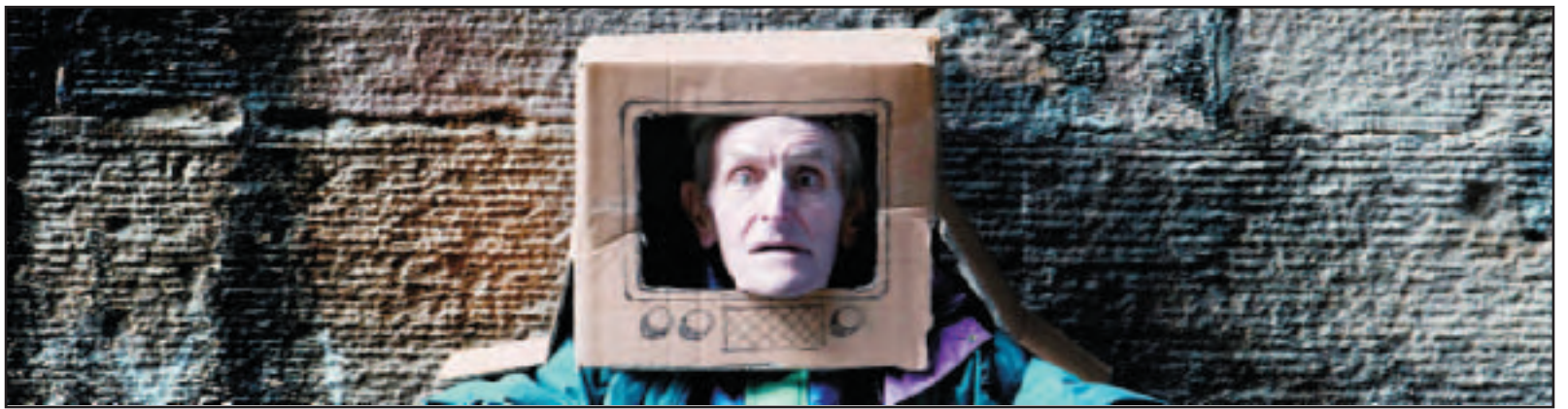
Tormod Mac Gill-Eain

Aig toiseach Slaightearan tha gach prìomh character a' toirt dhan leughadair a dhealbh fhèin air fhèin. 'S e chiad fhear a nì seo, Murchadh a tha sreap ris an dà fhichead, à Beinn a' Bhaoghla, a tha tàmh an Glaschu, oileanach iar-cheumnach ann an rianachd sgiobachd. Their e san dol seachad gu bheil tè fo aois tric-