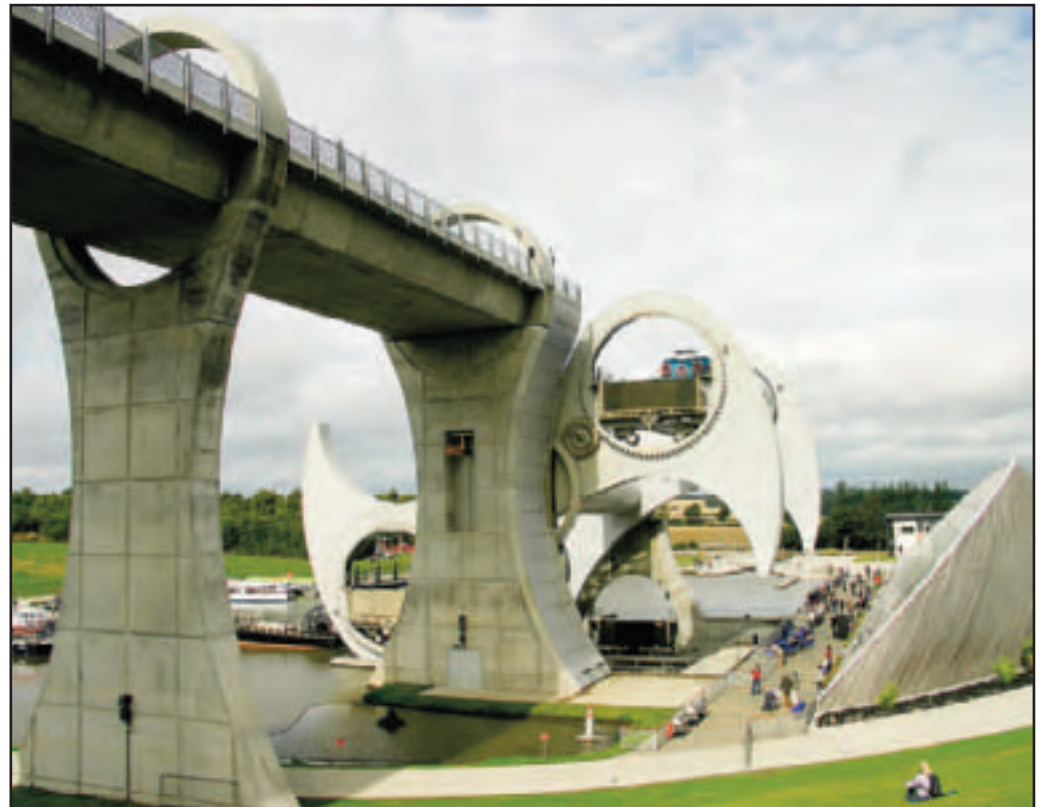
Tha mòran goireasan tarraingeachd sa bhaile