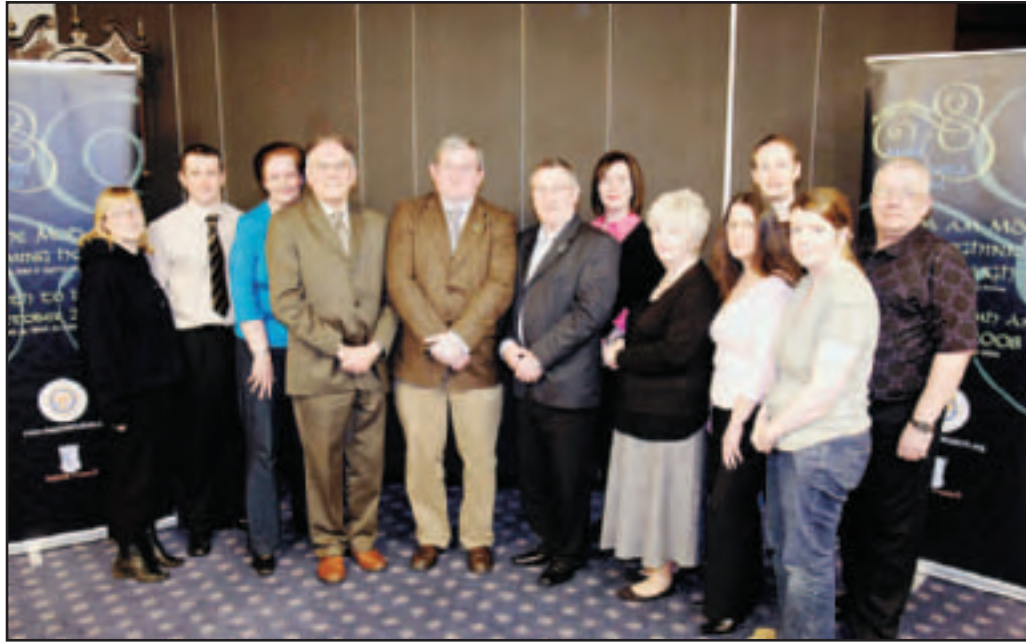
Comataidh ionadail Mòd na h-Eaglaise Brice

Am-bliadhna chaidh am Mòd ainmeachadh mar Phrìomh Thachartas na Bliadhna aig na Duaisean Ciùil Traidiseanta. Tha am Mòd a' faighinn taic bho Bhanca Rìoghail na h-Alba, Comhairle na h-Eaglaise Brice agus Caledonian Mac a' Bhriuthainn. Gheibhear tuilleadh fiosrachadh aig: www.mod2008falkirk.org .