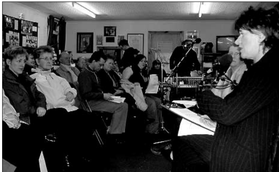
Air an eadar-lìon, air an rèidio agus air an telebhisein, gheibh an luchd-èisteachd cothrom gu leòr air an t-sreath ùr.