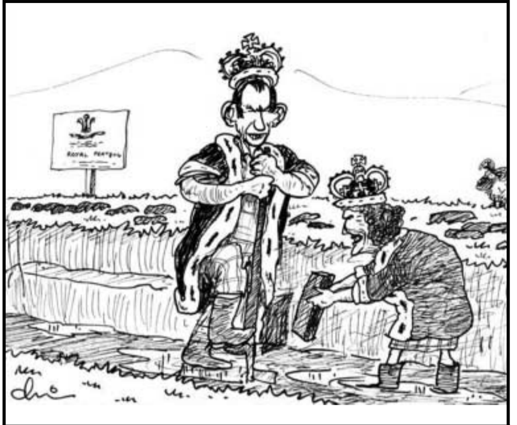
Bana-Thriath nan Eilean — "Nach d' thuirt mi ruit nach robh mo mhathair toilichte"

Nach eil Bana-Thriath nan Eilean, mo chreach. 'B' fheàrrda sinn sin. 'S dòcha gu cuireadh ise casg air na tuathan-gaoithe?