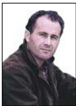
Sùil air Spòrs Le Ailig O' Hianlaidh

As dèidh na butarras a rinn maighstir Anndra Davis aig Tynecastle an t-seachdain seo chaidh tha fios gu bheil an latha an uair a theid teicneòlas a chleachdadh ann am ball-coise ceum nas