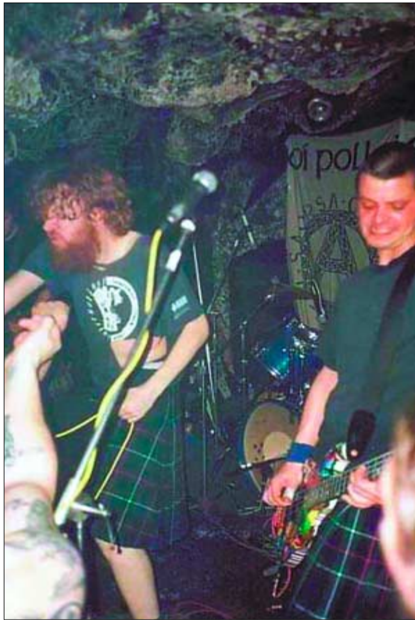
Tha na còmhlain "Oì Polloi" agus "Mill a h-Uile Rud" a' toirt na Gàidhlig gu luchd-èisteachd nach eil 's dòcha robh chleachta air a' chànan a chluinntinn

Tha Blas — pròiseact gus fèis chiùil Cheilteach a chur air dòigh sa Ghaidhealtachd — air fiathachadh a chur gu buidhnean coimhearsnachd gus pàirt fhoirmeil a ghabhail san tachartas ùr inntinneach ac', a theid a chur air adhart aig deireadh an t-samhraidh.