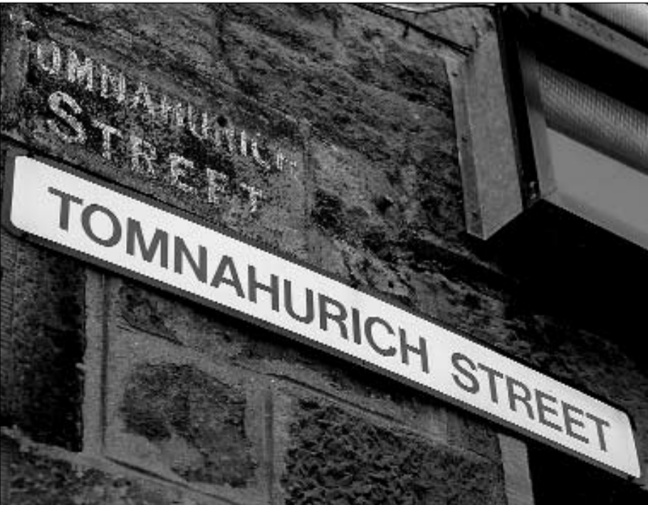
Tha tús Gàidhlig glè fhollaiseach air mòran de dh'ainmean sràidean baile Inbhir Nis — a dh'aoidheoin de a' chomhairlichean ag ràdh