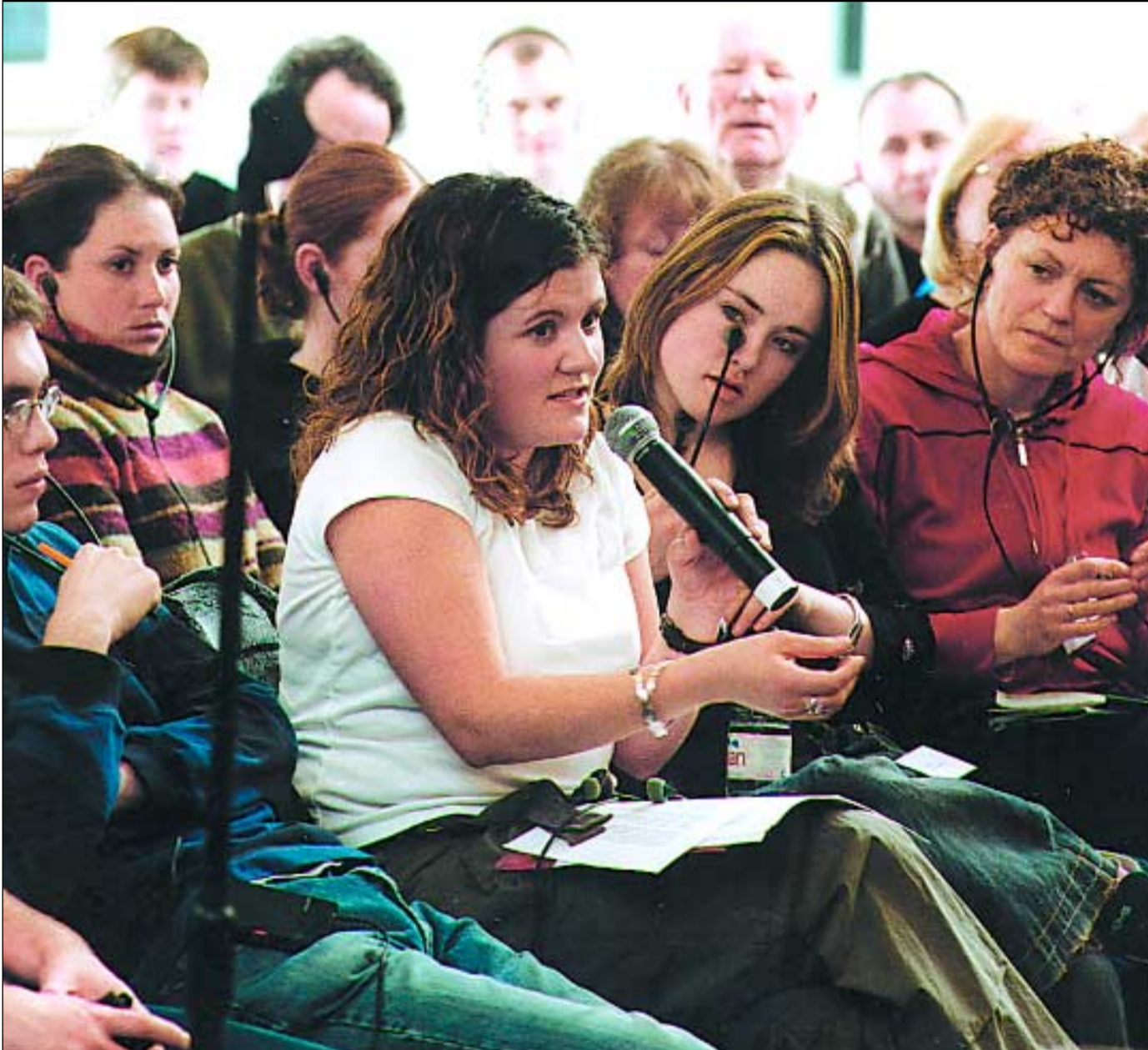
Thèid Parlamaid nan Oileanach — aon de na prìomh thachartasan airson Gaidheil Alba is Èirinn a thoirt còmhla — a chumail ann an Corcaigh aig deireadh na mìos seo Sgeulachd duilleag 3