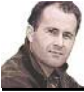
Sùil air Spòrs Le Ailig O'Hianlaidh

Nach ann air sgioba ball-coise na h-Alba a thàinig an dà latha. Beagan sheachdainean air ais, cha toireadh tu ho airson nan teansaichean againn