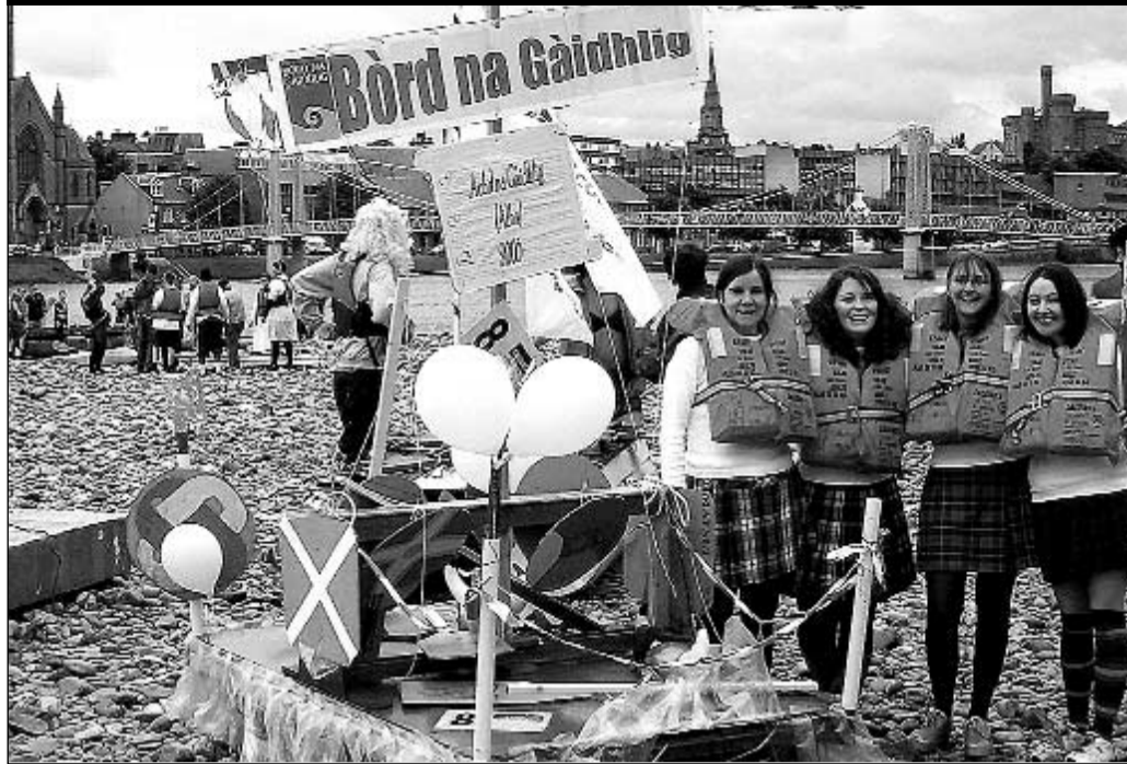
Sgioba Rù-Rà aig Bòrd na Gàidhlig air ais air tìr an dèidh pàirt a ghabhail ann an Rèis nan Ràthan air Abhainn Nis. Thog an sgioba £350 airson a' charthannais Children 1st agus tha iad a' toirt taing do UBC, Scotnet agus Scottish Water airson an cuid taic leis an ràth agus dhan a' h-uile duine a nochd air an latha.