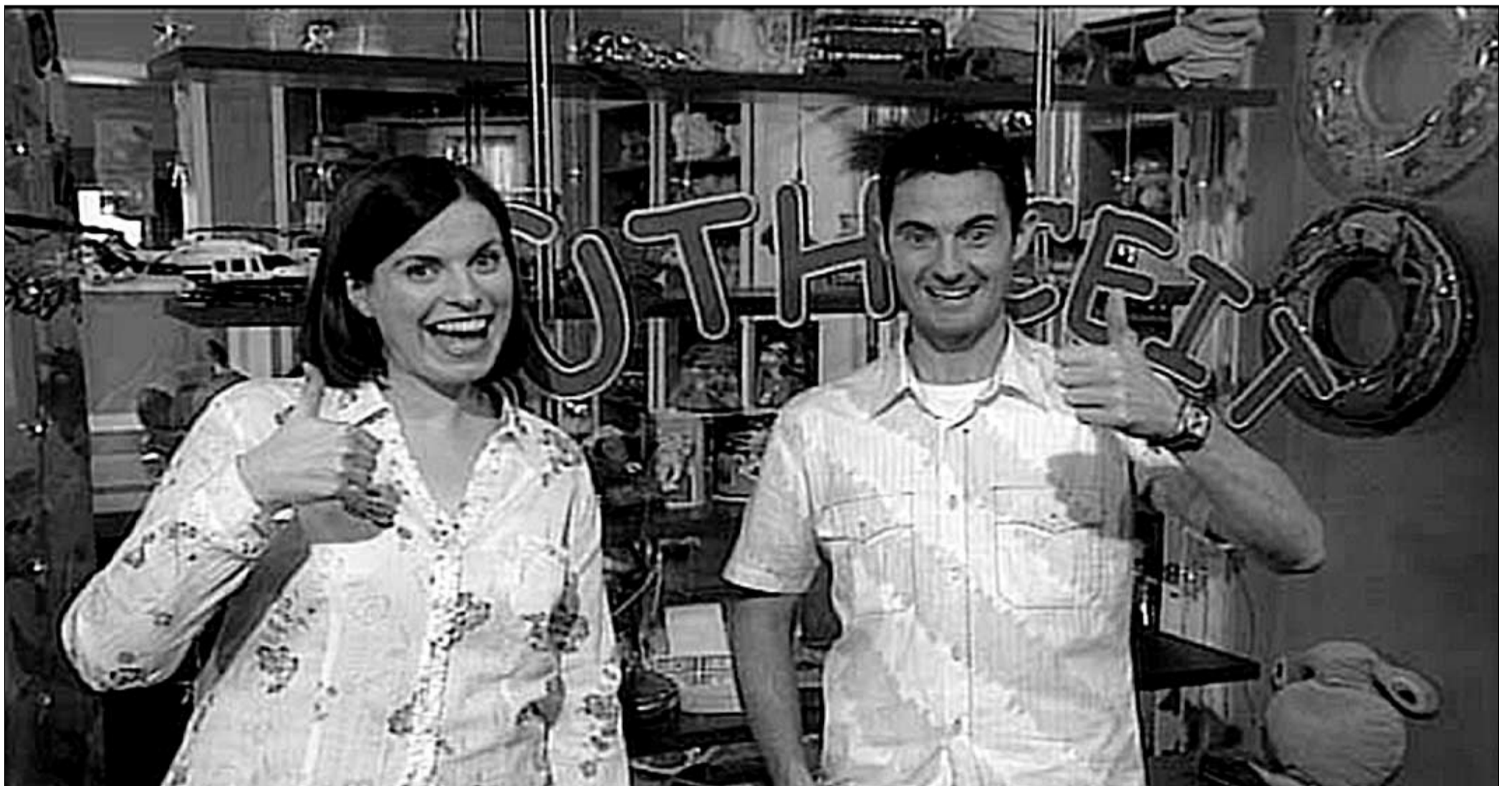
Wilma NicUalraig is Tonaigh Kearney anns a' Bhuth

Tha fiosrachadh a bharrachd airson tidsearan air an eadar-lìon aig bbc.co.uk/foghlam .