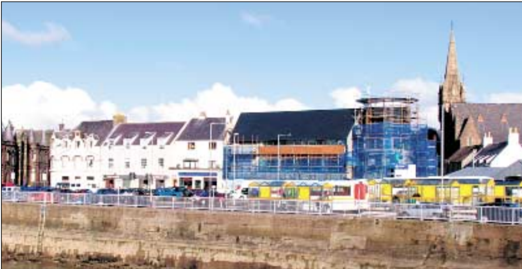
Chithear An Lanntair ùr gu foillseachadh a' coimhead a-mach air caladh a' bhaile

Thèid taisbeanadh a chur air dòigh sa chiad dol a-mach mu dheidhinn seann àite-gnìomhachais sheòl a b' àbhair a bhith ann an Steòrnabhagh agus thèid dealbh-chluich a chur air an àrd-ùrlar, "A Beautiful Day", le sgrìobhaiche is cleasaiche bho na h-eileanan, Iain Fionnlagh MacLeòid is Iain MacRath.