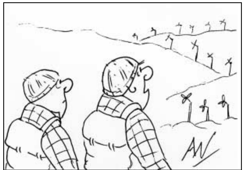
“Chan eil mi buileach cinnteach, mur ann airson nam meanbh-chuileagan a tha iad”

Thèid freagairtean nam pàrantan a chur air beulaibh a' chomhairle an ath mhìos.